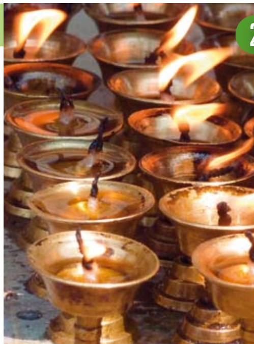
Butterlampen in Bodnath.

Es ist natürlich nicht gesichert, dass man diesen Moment wirklich genießen kann: zu viele Leute und/oder der Kopf scheint zu bersten. Schließlich ist man an einem der berühmtesten Aussichtspunkte und der liegt auf 5545 m. Geht es einem gut, dann kann man sich dieser Faszination nicht entziehen. Everest und Nuptse ragen vor einem auf, die Dimensionen des Himalaja werden spürbar, die ganze Faszination und der Irrsinn des Bergsteigens werden in den Legenden über die Erst- und Folgebesteigungen des Dritten Pols widerspiegelt. Dadurch eventuell angeregt zu philosophischen Betrachtungen, kann man heutzutage diese gleich bei einem Bier in Gorak Shep fortsetzen oder mittels Handy oder Internet der ganzen Welt mitteilen.