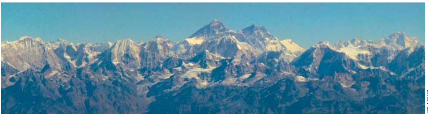
Zum Sattsehen – ein Flug entlang des Himalaja.

Was gibt es noch für fantastische Bergziele, abgesehen von den dominierenden bekannten hohen Spitzen? Was müssen frühere Forscher geleistet haben, all dies kartographiert zu haben?