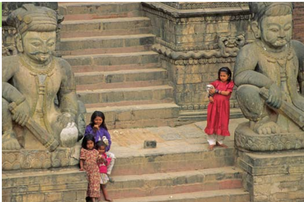
Sehenswerte Paläste der Königsstadt Bhaktapur.